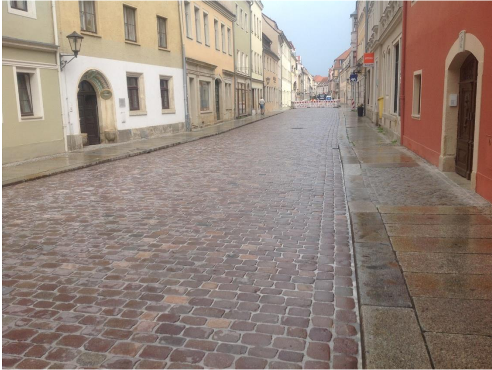
Bild 4: Die sanierte Lange Straße in Pirna. Auch neu verlegt, in gebundener Bauweise, fügt sich der wiederverwendete Pflasterbelag optimal in das historische Stadtbild ein.

https://pics.pci-augsburg.com:443/php/index.php?database=2&downloadimage=9190&size=1772x1323&format=&check=45a54909daffc8137941f795bc3c787