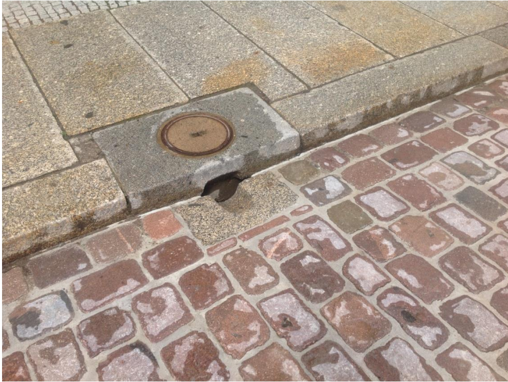
Bild 7: Der nicht drainfähige Fugenmörtel leitet das Wasser bis zu den Ablaufrinnen weiter, wo es direkt in die Kanalisation abfließen kann.

https://pics.pci-augsburg.com:443/php/index.php?database=2&downloadimage=9193&size=1772x1323&format=&check=fbf103e5b3aa4c8cf5c74f5bb43916c5