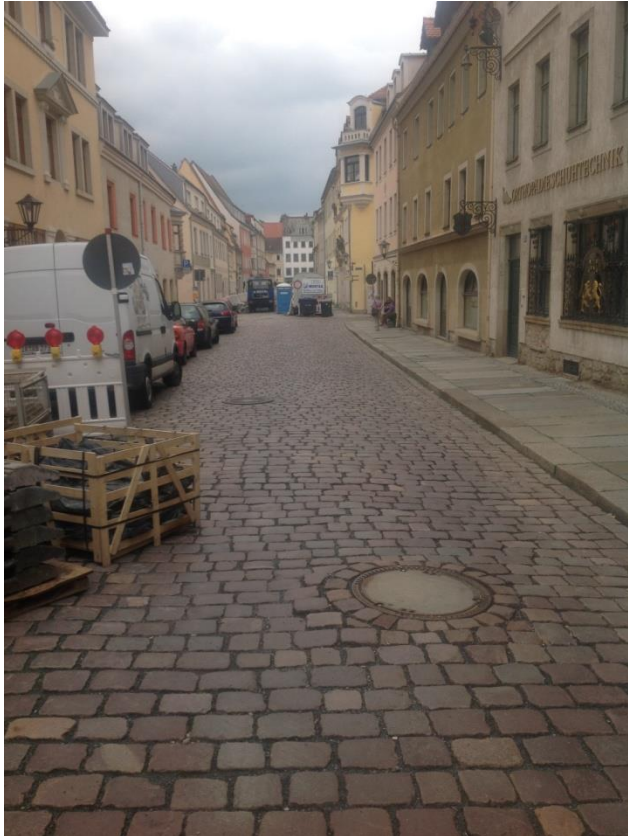
Bild 1: Vor der Sanierung war das Granitpflaster in ungebundener Bauweise verlegt. Wasser oder Starkregen setzt den Fugen mitunter stark zu, schlimmstenfalls wird der Belag durch ein Hochwasser komplett unterspült.

https://pics.pci-augsburg.com:443/php/index.php?database=2&downloadimage=9187&size=1323x1772&format=&check=af82ffdf0bf49e7bb6b7638cf7ce1f5