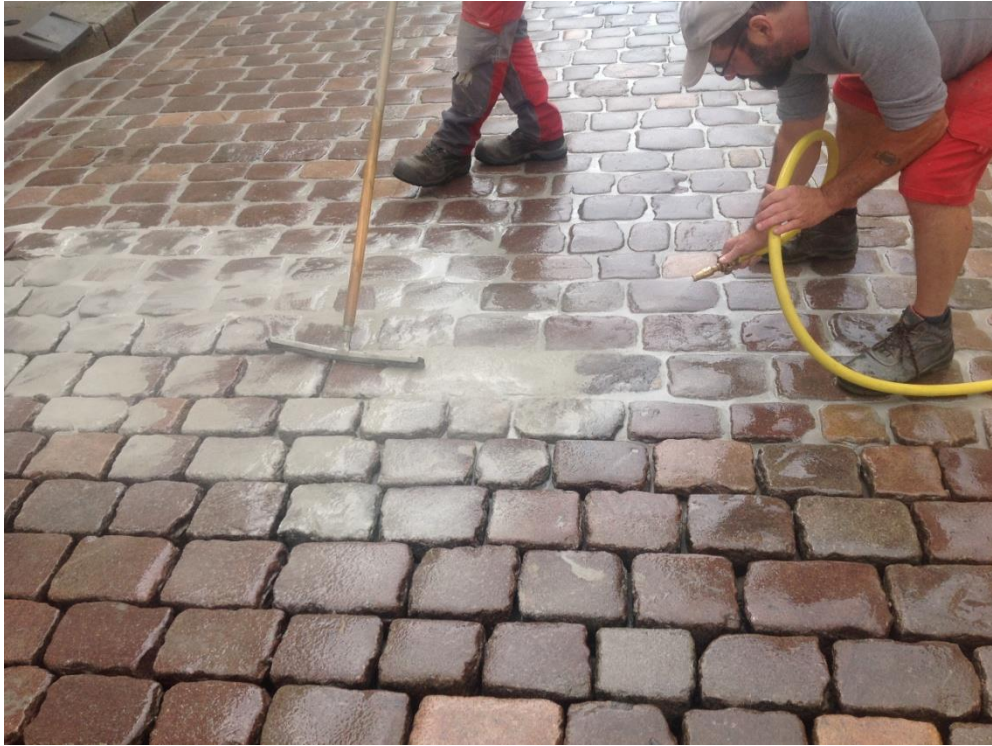
Bild 3: Die Verarbeiter brachten den Fugenmörtel PCI Pavifix CEM mit einem Gummischieber in die Fugen ein und spritzten das Pflaster anschließend mit einer Flachstrahldüse ab.

https://pics.pci-augsburg.com:443/php/index.php?database=2&downloadimage=9189&size=1772x1323&format=&check=f9fa9d1c466339c2950f7cc7f9ed8453