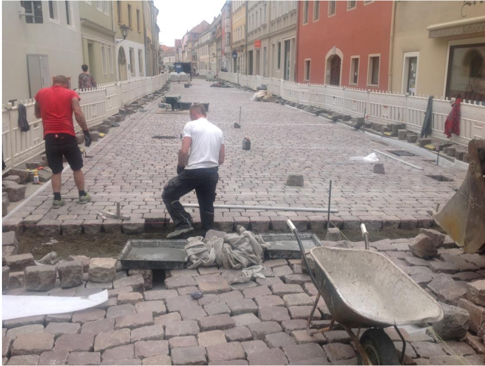
Bild 2: Die alten Pflastersteine wurden aufgenommen und neu verlegt. Das Schlämmverfahren ermöglichte einen schnellen Arbeitsfortschritt.

https://pics.pci-augsburg.com:443/php/index.php?database=2&downloadimage=9188&size=1772x1323&format=&check=3985acb3db2675a74ccaafa22c8e1bc3