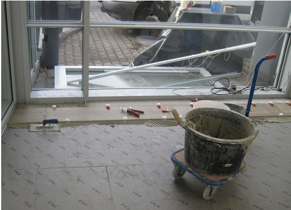
Bild 2: Servicebereich: Gleicher Bodenaufbau wie im Showroom. Der einzige Unterschied – die Fliesen: Statt Anthrazit (Marazzi, 60 x 60 cm) kam Holzoptik (Marazzi, 30 x 120 cm) zum Einsatz.

https://pics.pci-augsburg.com:443/php/index.php?database=2&downloadimage=9108&size=3648x2736&format=&check=66e31eb5f90f77501b2968d6aa607ddd