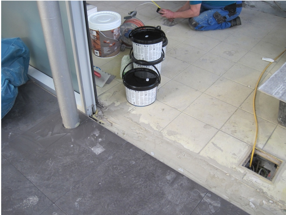
Bild 3: Übergang von den neu verlegten anthrazitfarbenen Fliesen zum Altbelag: Hier wurden die Fliesen zunächst angeschliffen, mit der Schutz- und Haftgrundierung PCI Gisogrund 303 grundiert und die Unebenheiten anschließend mit PCI Nivelliermasse ausgeglichen.

https://pics.pci-augsburg.com:443/php/index.php?database=2&downloadimage=9109&size=3648x2736&format=&check=76a4fdbc846c35c0f448c81d9af33c02