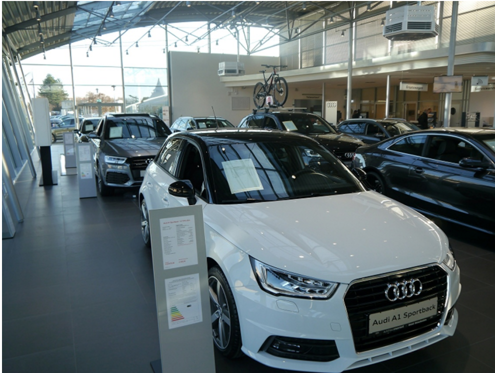
Bild 5: Das sanierte Audi-Autohaus: Große Karossen auf großen Fliesen. Das passt zusammen und wertet den Präsentationsraum optisch auf.

https://pics.pci-augsburg.com:443/php/index.php?database=2&downloadimage=9111&size=4608x3456&format=&check=c56e7f4e8b32c794cf4597fa16ade984