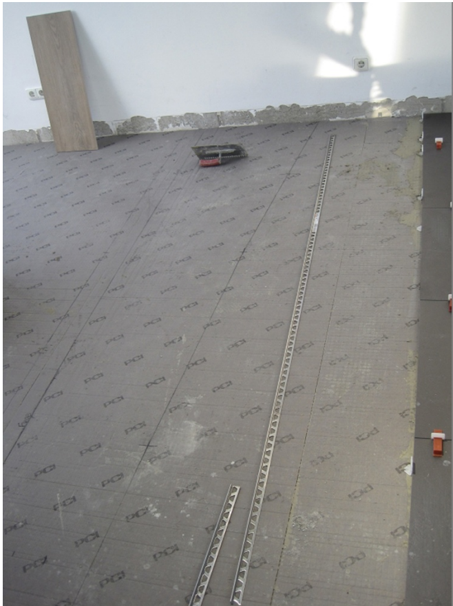
Bild 1: Bodenaufbau im Showroom: Auf dem vorbereiteten Untergrund wurde die Entkopplungsbahn PCI Pecilastic E verklebt. Darauf verlegten die Fliesenleger die anthrazitfarbenen Platten mit dem hochflexiblen PCI Flexmörtel S2.

Bilder (Verwendungszweck beim Download: „PI“)