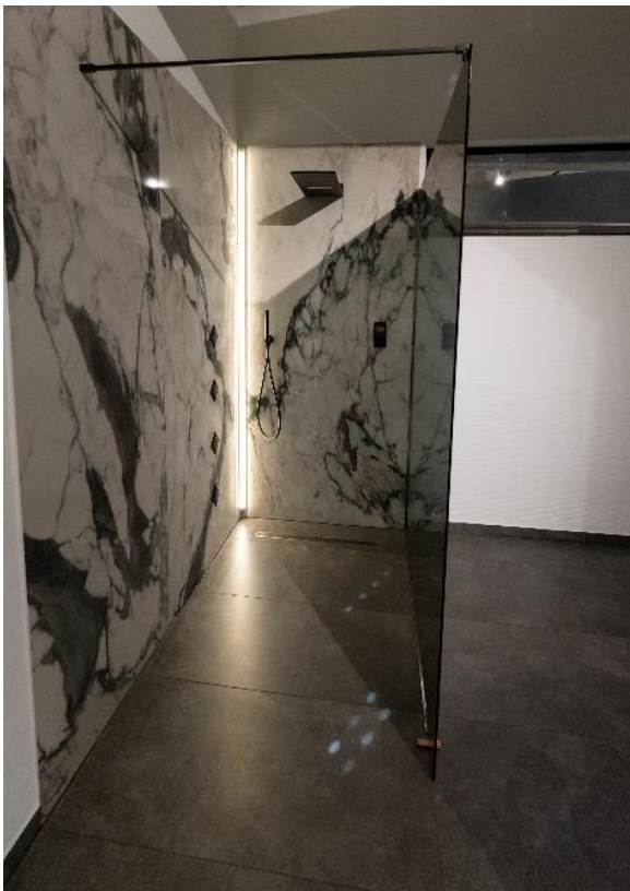
Die großformatigen Fliesen wurden mit PCI FT Flex und PCI Flexmörtel S1 Flott verklebt. ( Link zum hochauflösenden Photo)