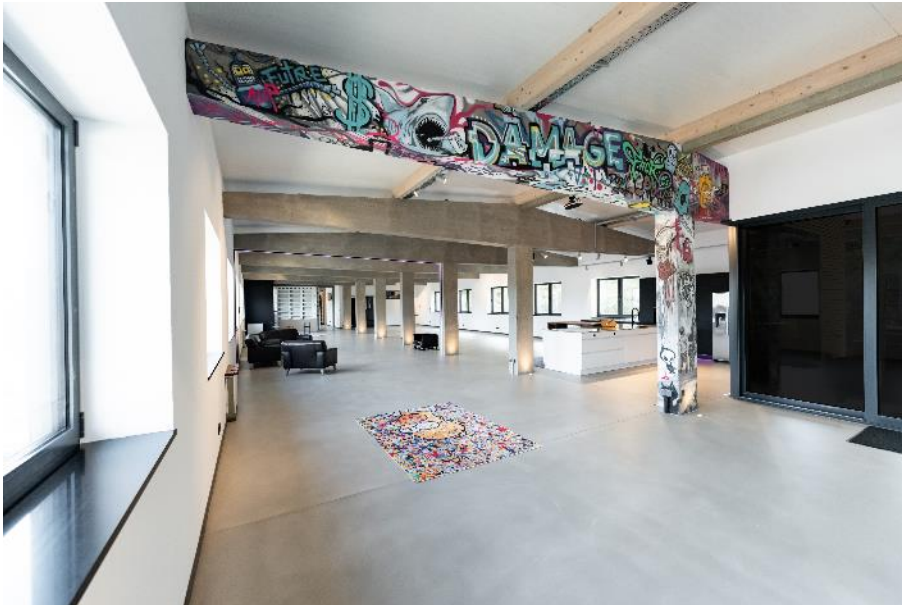
Sichtbeton mit PCI Zemtec 1K, versiegelt mit PCI Zemtec Top. ( Link zum hochauflösenden Photo)