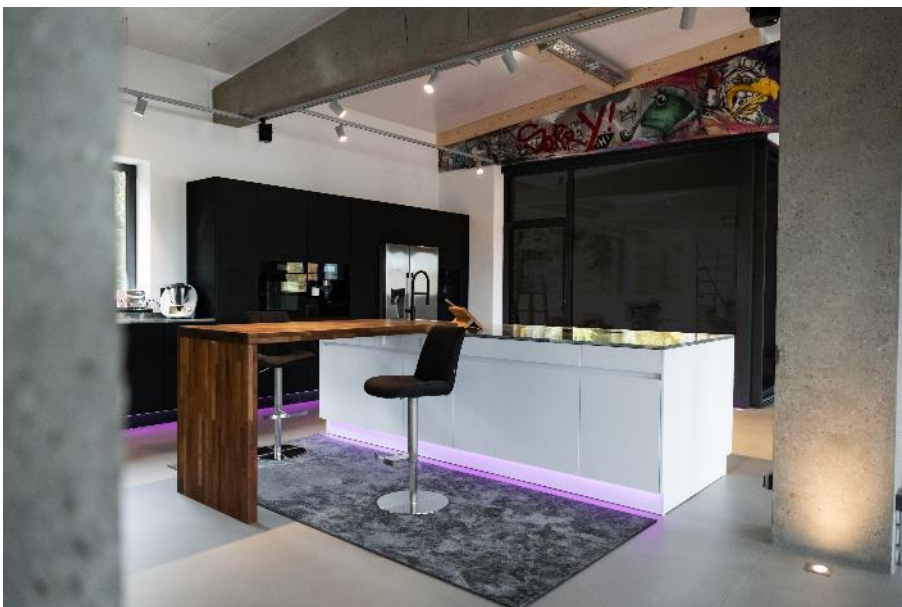
Ein Unikat – die Loftwohnung mit schlichtem Sichtbetonboden und modernem, wohnlichem Mobiliar. ( Link zum hochauflösenden Photo)