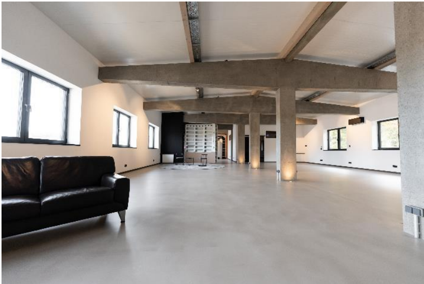
Einfache Verarbeitung, überzeugendes Ergebnis: Die Sichtbetonspachtelung besticht mit ihrer fugenfreien Oberfläche. ( Link zum hochauflösenden Photo)