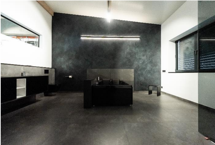
In den Bädern kam als Fugenmörtel PCI Durapox Premium mit seiner großen Farbauswahl zum Einsatz. ( Link zum hochauflösenden Photo)